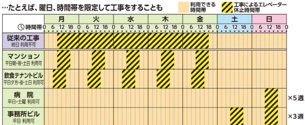
リノベーション工事中のエレベーター利用イメージ