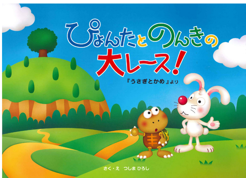
絵本「ぴよんたとのんきの大レース」

さらに、Webサイト( http://www.meltec.co.jp )に掲載している安全な乗り方を学習できるクイズをリニューアル。全5問正解するとパソコンのデスクトップにメモを記入できる「ぴよんたとのんきのメモ帳」がダウンロードできるようになりました。