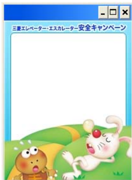
ぴよんととのんきのメモ帳