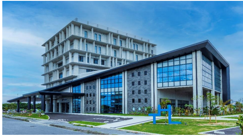
タツプホスピタリティラボ沖縄

「タツプホスピタリティラボ沖縄」に「ロボット移動支援サービス」を提供 他社製エレベーターと連携したロボット運用の実証を推進し、ホテル業界のDXに貢献