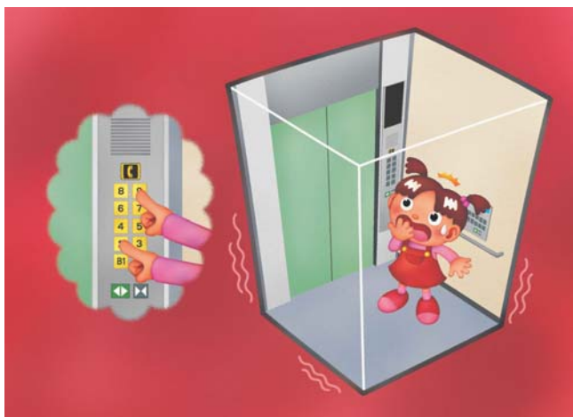
地震のときにエレベーターに乗っていたら・・・