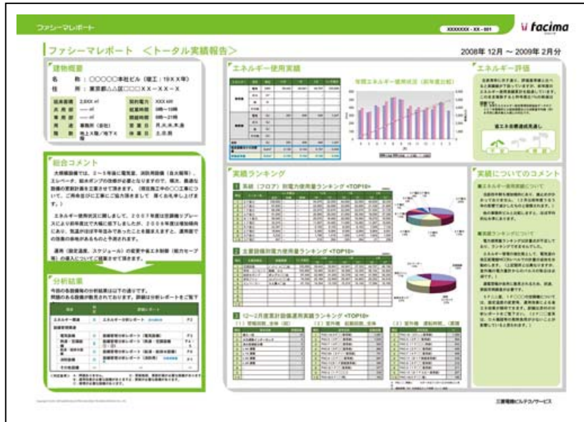
【トータル実績報告書】