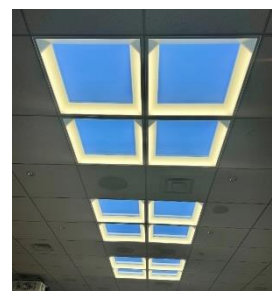
「ビジョンシアター」内の 天井に設置した青空照明「misola」