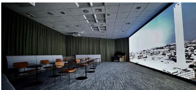
プレゼンテーションルーム「ビジョンシアター」

青空照明「misola（みそら）」を天井に配したプレゼンテーションルームには、迫力ある大型スクリーン（高さ2.8m×幅約10m）を設置し、ビルソリューションが実現していく未来社会をイメージしたコンテンツをご紹介します。また、お客さまのビル設備の日々の安全・安心を24時間365日支える当社「情報センター」「物流センター」、製品の開発や保守メンテナンスを支える人材育成など、ライブ映像なども交えて紹介します。