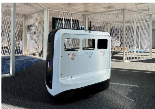
ゴミ回収を行うロボット